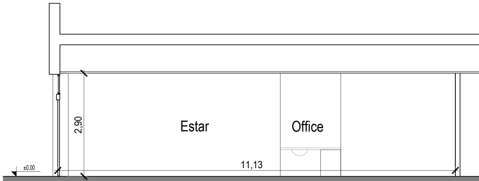
Corte longitudinal- Sala Vip cabotaje